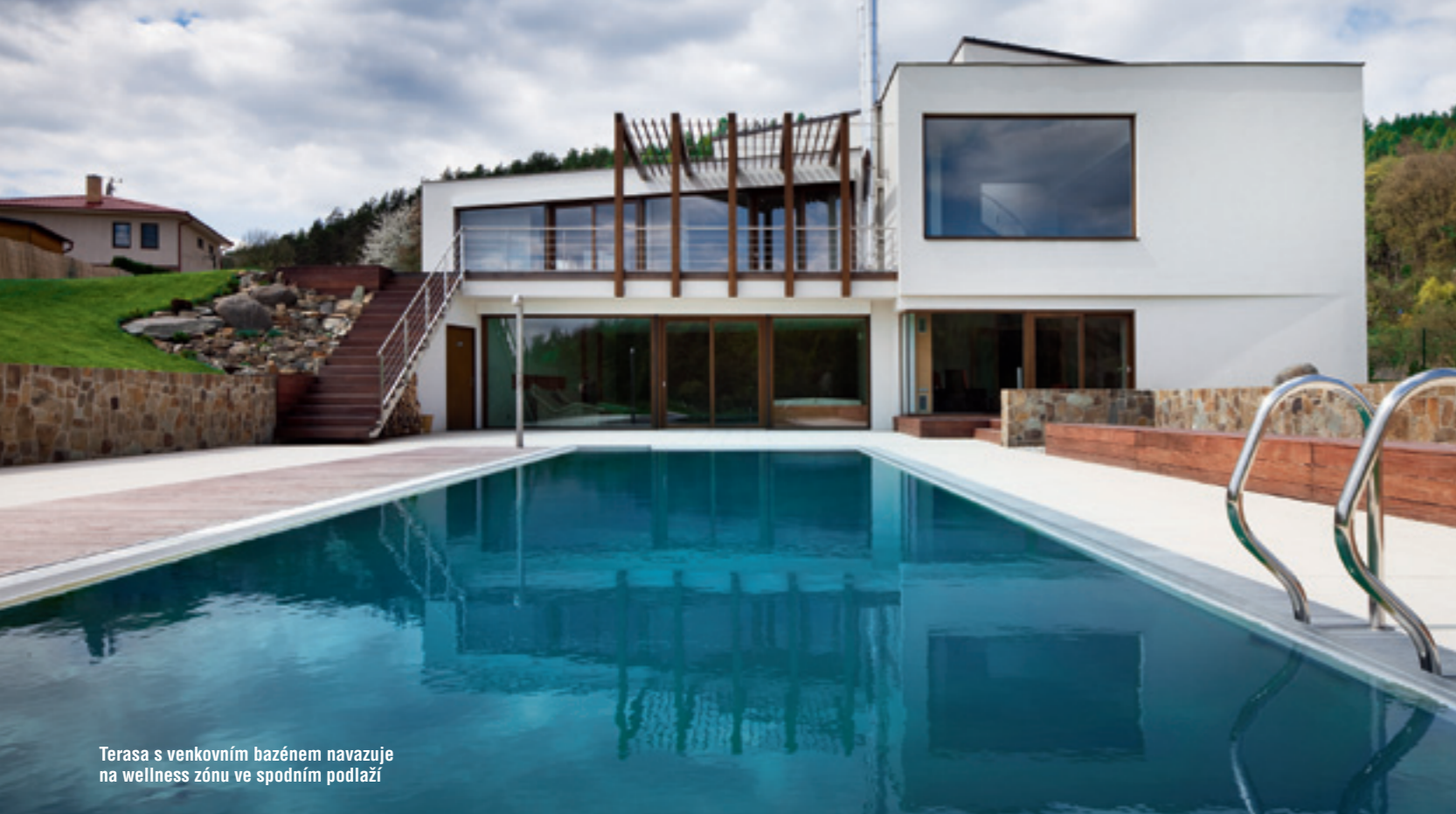
Terasa s venkovním bazénem navazuje na wellness zónu ve spodním podlaží