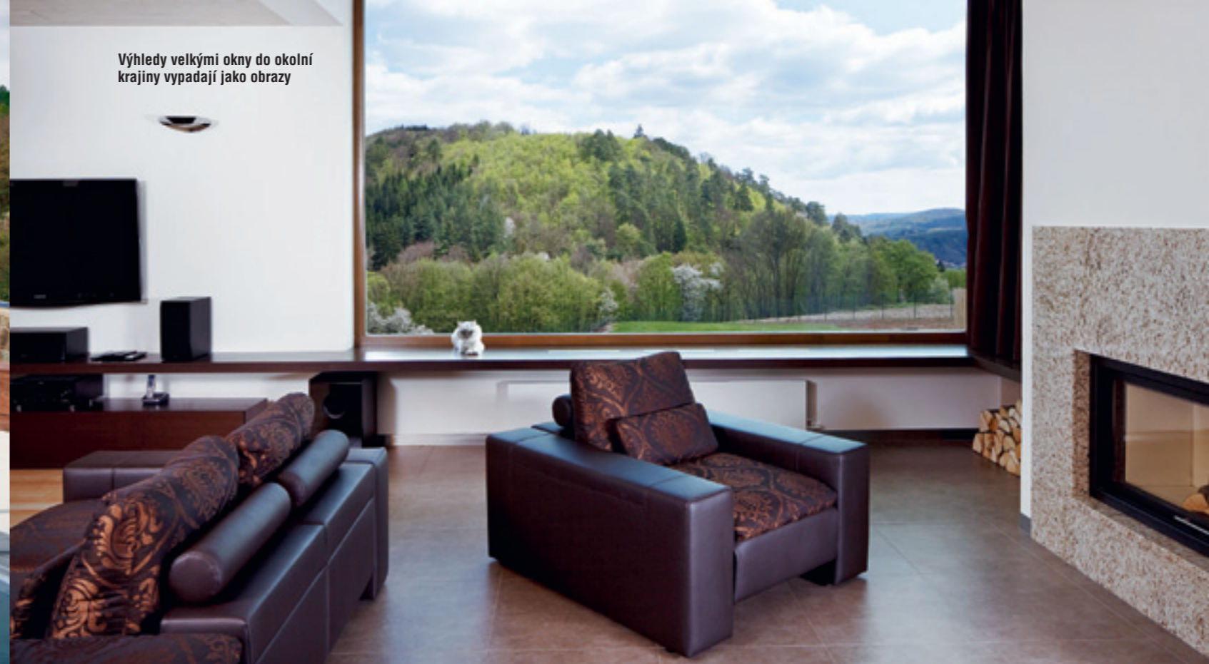
Výhledy velkými okny do okolní krajiny vypadají jako obrazy

Dům se nachází v menší obci, která těží z polohy v krásné krajině i blízkosti jihomoravské metropole. Obec leží v údolí říčky a od jejího severního okraje se rozprostírá rozsáhlý les. Rozlehlá parcela se nachází v lokalitě, která je charakteristická řídnoucí zástavbou rodinných domů a chat postupně přecházející v les.